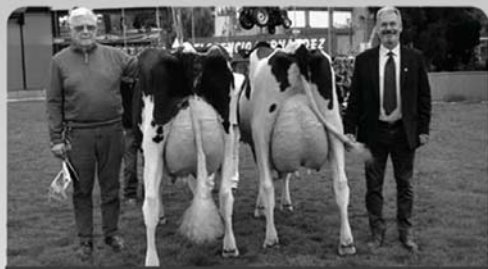
Gran campeona y res. Gran campeona 2023