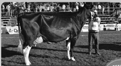
Gran campeona PI Prado 2024

REALICE PREFERTA PARA TOROS Y OBTENGA BENEFICIOS.