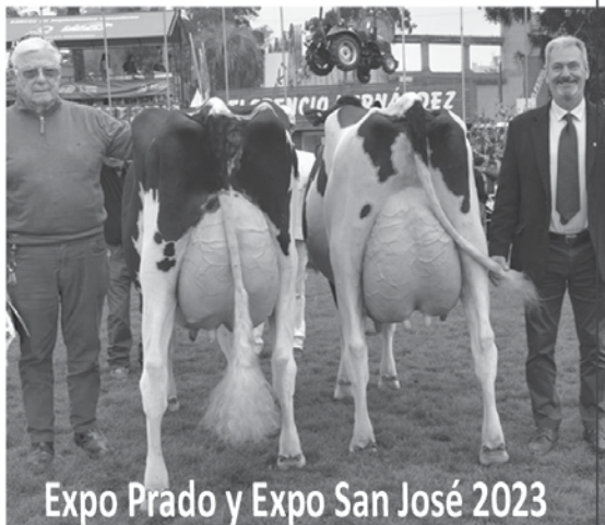
Expo Prado y Expo San José 2023